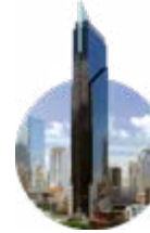
2012 Towe Financial Center

Una de las torres más icónicas que se pueda ver en el cielo panameño. Premiado por Camas como el proyecto residencial más alto de Latinoamérica.