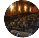
2013 Cinepolis Westland mall