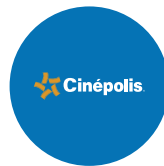
2008 Cinepolis MP

Cinépolis llega a Panamá de la mano de Desarrollo Bahía. La primera sala de cine con pantallas de última tecnología en el país.