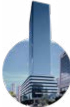
1998 Plaza Banco General

Desarrollo Bahía puso un pie en el mundo de la hospitalidad, marcando la diferencia con el primer hotel lujoso. El primer Marriott en el país.