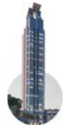
2014 Country Club

Lujo y negocios se fusionan en uno de las más elegantes e icónicas torres en la ciudad de Panamá. La torre Towerbank.