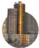
1993 Mar de Plata