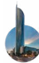
2015 Financial Park