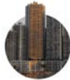
1996 Villa Marina

El principio del sueño que hoy lleva más de 30 años. Mediterrané fue nuestro primer proyecto bajo construcción, en su momento uno de las torres más altas en Panamá.