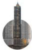
2004 Punta Roca