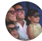
2017 Cinepolis Dorado Mall