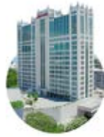
1998 Hotel Marriott Panamá

Desarrollo Bahía puso un pie en el mundo de la hospitalidad, marcando la diferencia con el primer hotel lujoso. El primer Marriott en el país.