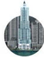
2003 Bahía Pacífica

Desarrollo Bahía puso un pie en el mundo de la hospitalidad, marcando la diferencia con el primer hotel lujoso. El primer Marriott en el país.