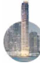
2012 The Point

Una de las torres más icónicas que se pueda ver en el cielo panameño. Premiado por Camas como el proyecto residencial más alto de Latinoamérica.