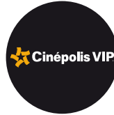
2011 VIP Multiplaza

Presentándonos en el mundo comercial, fuimos parte de la construcción del más lujoso, amplio y reconocido centro comercial en el país.