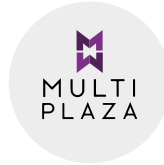
2008 C.C. Multiplaza pacific

Presentándonos en el mundo comercial, fuimos parte de la construcción del más lujoso, amplio y reconocido centro comercial en el país.