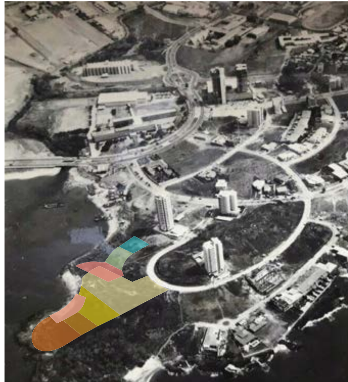
Bahía de Panamá 1965